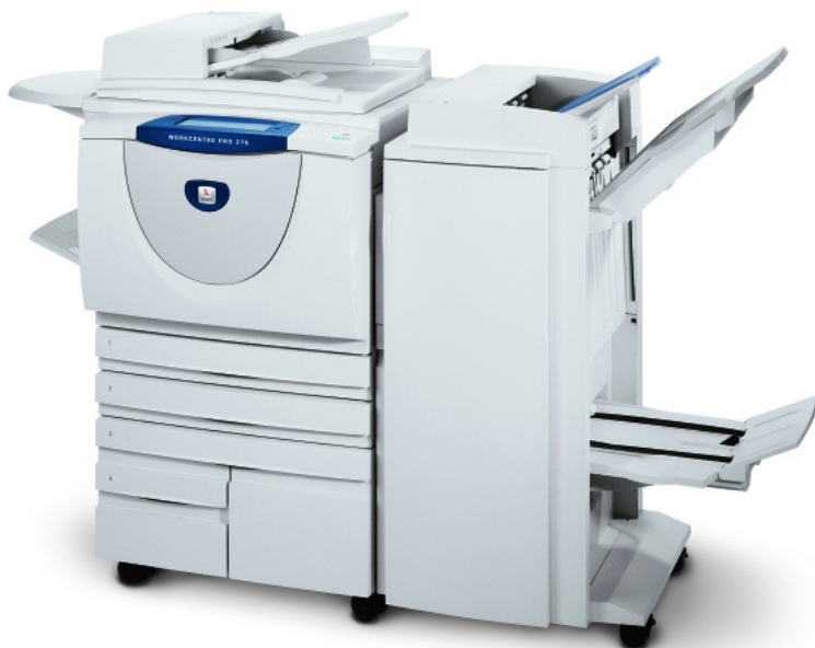
Kuvassa WorkCentre Pro 275 ja Professional-viimeistelijä

Täydellinen suurille toimistotyöryhmille ja kevyen tuotannon ympäristöihin.